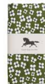
Belle Amie DUK Mörkgrön 145 x 250 cm 100% Bomull 102104-0038