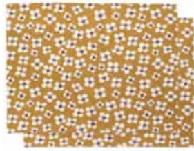
Belle Amie BORDSTABLETT (2-pack) Ockra 45 x 34 cm 100% Bomull 102070-0048