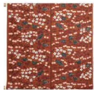
Körsbärsträdgården METERVARA Terrakotta Bredd 150 cm 100% Bomull 102067-0111