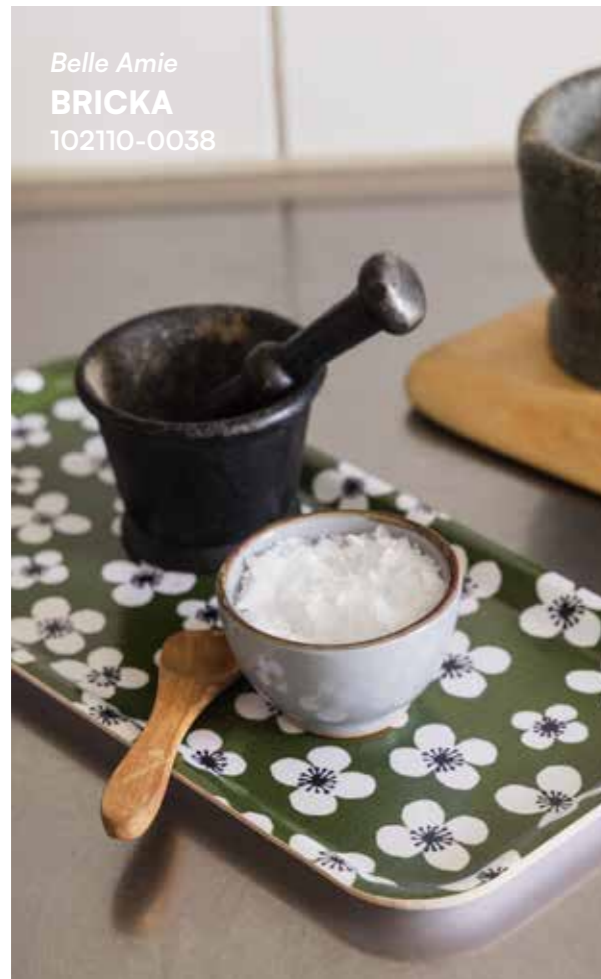
Belle Amie BRICKA 102110-0038