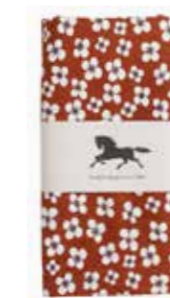
Belle Amie VAXDUK Terrakotta 145 x 220 cm 100% Bomull 102076-0018