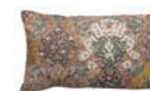
Botanic Garden KUDDFODRAL Beige multi 30 x 50 cm 53% Lin 47% Bomull 102106-0641