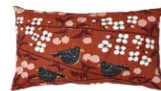
Körsbärsträdgården KUDDFODRAL Terrakotta 40 x 70 cm 100% Bomull 102069-0111