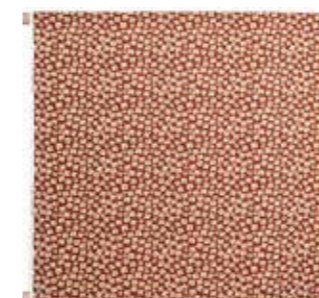
Belle Amie VAXDUK METERVARA Terrakotta Bredd 150 cm 100% Bomull 102075-0018