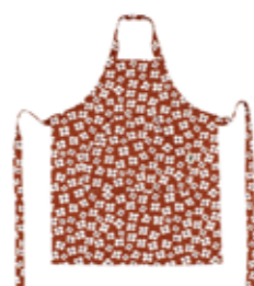
Belle Amie BARNFÖRKLÄDE Terrakotta 55 x 65 cm 100% Bomull 102105-0018