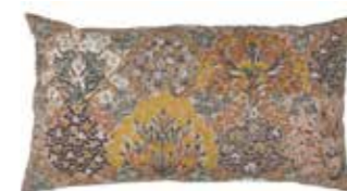
Botanic Garden KUDDFODRAL Beige multi 40 x 70 cm 53% Lin 47% Bomull 102107-0641