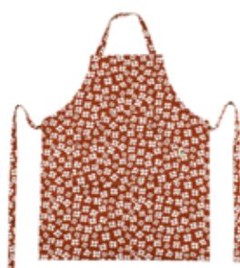
Belle Amie FÖRKLÄDE Terrakotta 68 x 83 cm 100% Bomull 102071-0018