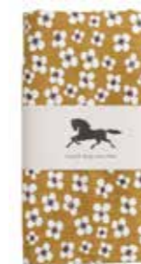
Belle Amie DUK Terrakotta 145 x 250 cm 100% Bomull 102104-0048