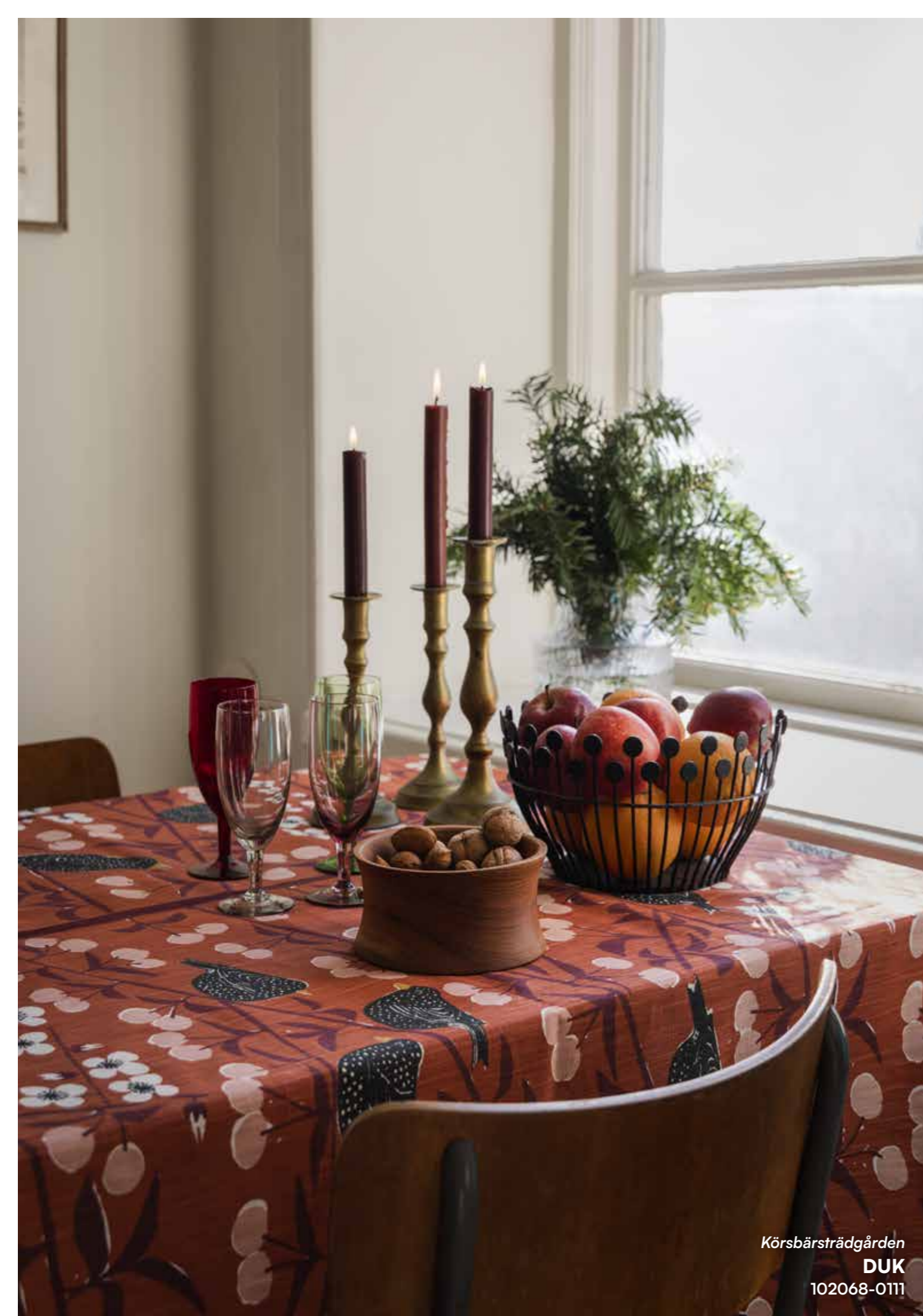
Körsbärsträdgården DUK 102068-0111