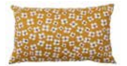
Belle Amie KUDDFODRAL Ockra 30 x 50 cm 100% Bomull 102109-0048