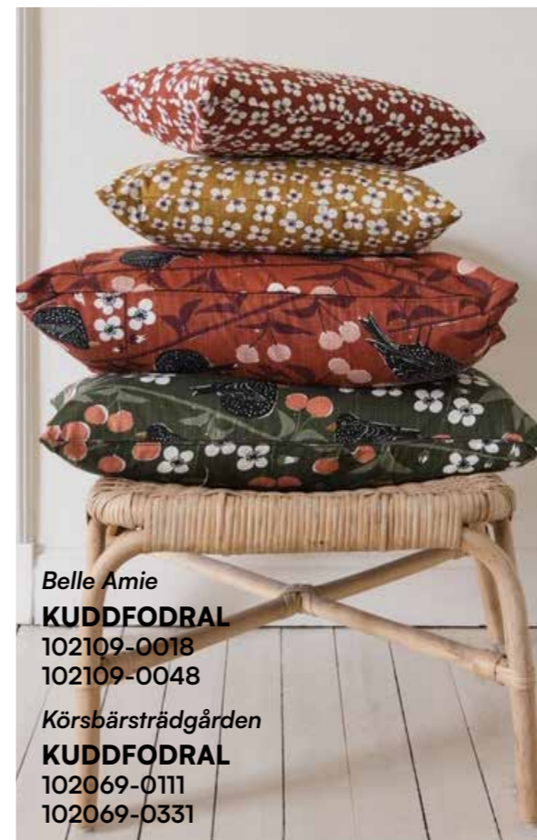
Belle Amie KUDDFODRAL 102109-0018 102109-0048 Körsbärsträdgården KUDDFODRAL 102069-0111 102069-0331