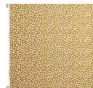
Belle Amie VAXDUK METERVARA Ockra Bredd 150 cm 100% Bomull 102075-0048