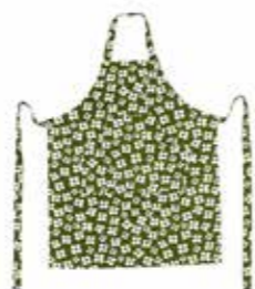
Belle Amie BARNFÖRKLÄDE Mörkgrön 55 x 65 cm 100% Bomull 102105-0038