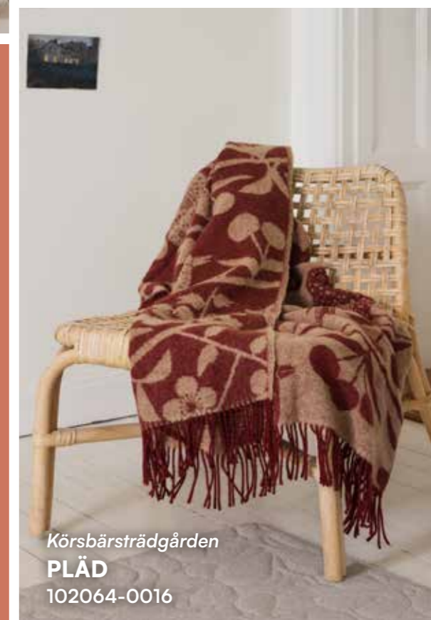
Körsbärsträdgården PLÄD 102064-0016

Stämningfulla kulörer. Terrakotta, vinrött, ockra och mörkgrönt — alla går att kombinera.