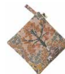
Botanic Garden GRYTLAPP Beige multi 23 x 23 cm 53% Lin 47% Bomull 101982-0641