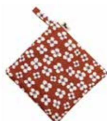
Belle Amie GRYTLAPP Terrakotta 23 x 23 cm 100% Bomull 102072-0018