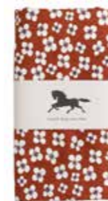
Belle Amie DUK Terrakotta 145 x 250 cm 100% Bomull 102104-0018