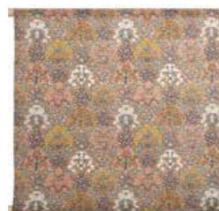
Botanic Garden METERVARA Beige multi Bredd 150 cm 53% Lin 47% Bomull 101977-0641