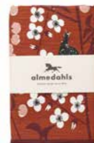
Körsbärsträdgården DUK Terrakotta 145 x 250 cm 100% Bomull 102068-0111