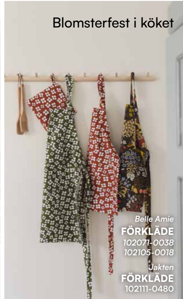
Blomsterfest i köket