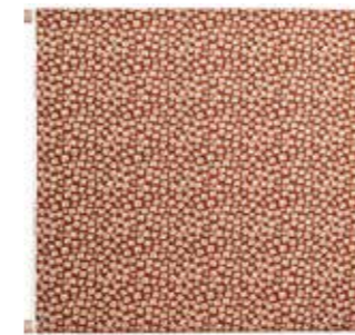
Belle Amie METERVARA Terrakotta Bredd 150 cm 100% Bomull 102066-0018