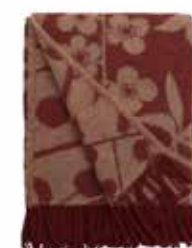
Körsbärsträdgården PLÄD Vinröd beige 130 x 170 cm 100% Ull 102064-0016