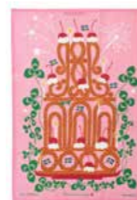
Hurra, hurra, hurra! KÖKSHANDDUK Rosa 47 x 70 cm 55% Lin, 45% Bomull 102102-0130