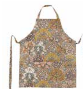
Botanic Garden FÖRKLÄDE Beige multi 68 x 83 cm 53% Lin 47% Bomu 101981-0641