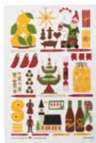
Lottas Julskafferi KÖKSHANDDUK Multi 47 x 70 cm 55% Lin, 45% Bomull 102103-0134