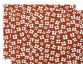
Belle Amie BORDSTABLETT (2-pack) Terrakotta 45 x 34 cm 100% Bomull 102070-0018