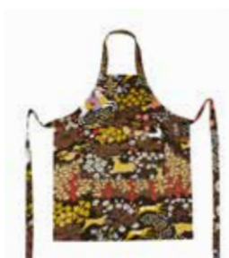
Jakten BARNFÖRKLÄDE Brun 55 x 65 cm 100% Bomull 102111-0480