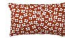
Belle Amie KUDDFODRAL Terrakotta 30 x 50 cm 100% Bomull 102109-0018