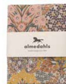
Botanic Garden DUK Beige multi 145 x 250 cm 53% Lin 47% Bomull 1101979-0641