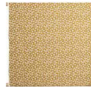
Belle Amie METERVARA Ockra Bredd 150 cm 100% Bomull 102066-0048