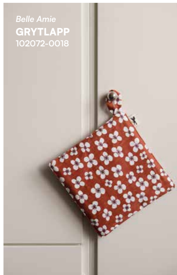
Belle Amie GRYTLAPP 102072-0018